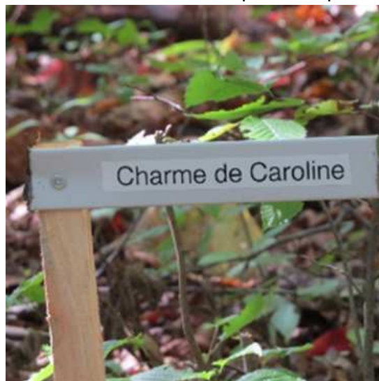
Un des 85 petits panneaux d'identification d'espèces.

Cette année, CIEL a récidivé en lançant une invitation publique à une marche dans le sentier situé à la limite est (2 km) du Secteur J.-L.-G. de la RN du Coteau-de-la-Riv.-La Guerre . Le hasard a fait que, de nouveau, 45 personnes ont inscrit leur nom sur la liste des présences à cette marche. Ce succès est attribuable à la préparation minutieuse de l'événement par les bénévoles de CIEL qui, en plus d'agir comme guides pour les marcheurs, avaient préalablement installé quelques 85 petits panneaux informant sur l'identité d'autant d'espèces de plantes ligneuses et herbacées tout au long du parcours.