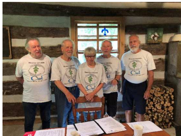
Le CA portant fièrement les nouveaux gaminets lors de leur réunion du 17 juillet 2023