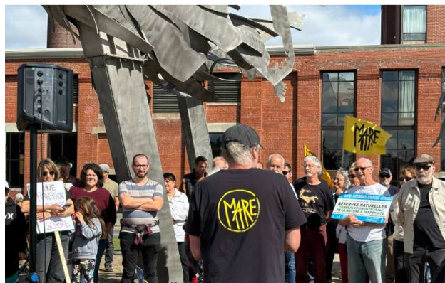
Salaberry-de-Valleyfield, le 27 septembre 2024

Le mouvement « Pour la suite du monde » réunit de vastes secteurs de la société québécoise comprenant une cinquantaine d'organisations dont des organisations syndicales, environnementales et communautaires représentant plus de 2 millions de personnes toutes mobilisées autour d'une vision démocratique de la transition environnementale et sociale.